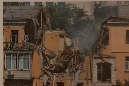
Wybuch butli z gazem w budynku mieszkalnym